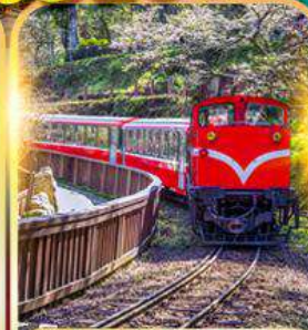
อุทยานอาหลี่ซาน